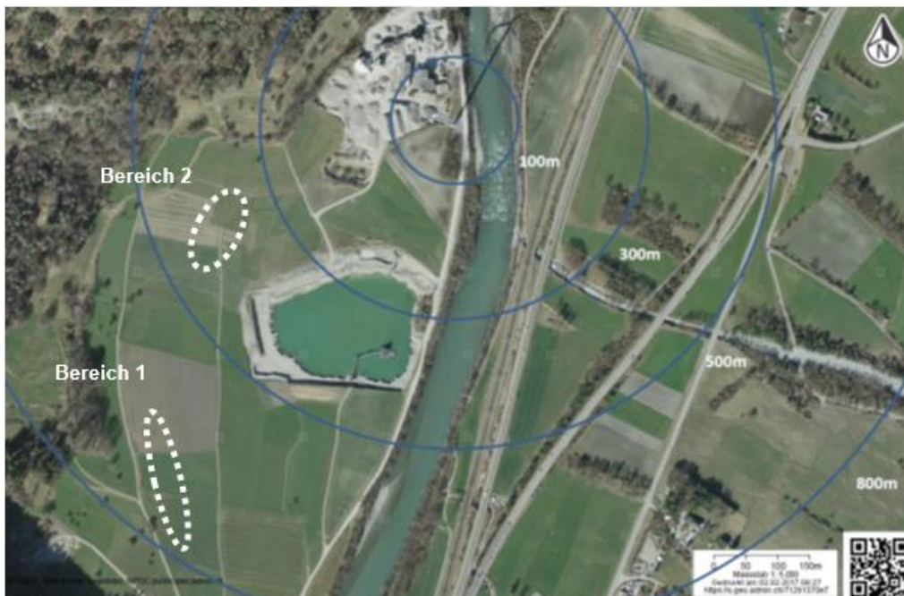
Abbildung 3: Äsungsbereiche der Rothirsche in den Nächten 25./26. und 26./27 Januar 2017

In der ersten Nacht hielten sich die einzelnen Individuen während der Beobachtungszeit im Bereich 1 auf, der 700-800m von der Anlage entfernt liegt (Abb. 3). Dieser wurde auch in der zweiten Nacht von fünf Rothirschen aufgesucht. Zudem nutzten drei andere Rothirsche intensiv auch den Bereich 2, der mit 350-400m eine deutlich geringere Distanz zum Windrad besitzt (Abb. 3 und 4).